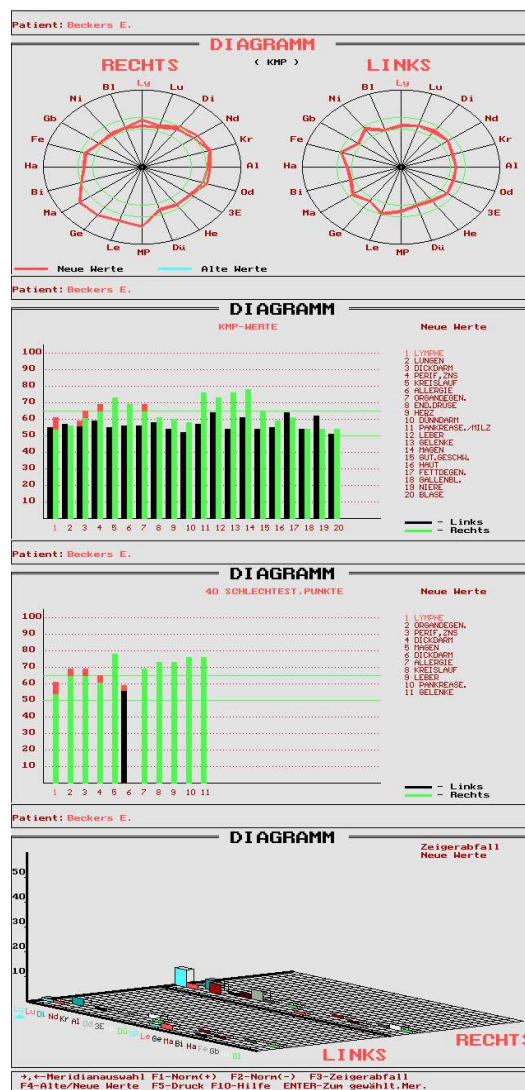
Zustand des Probanden eine Woche später nach einer einmaligen 40-minütigen Sitzung auf der UMH-Scheibe ( 18 cm Durchmesser)